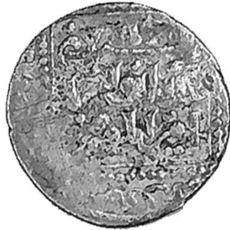
لوحة رقم (٢)