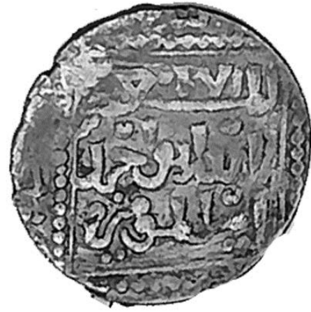
لوحة رقم (١)